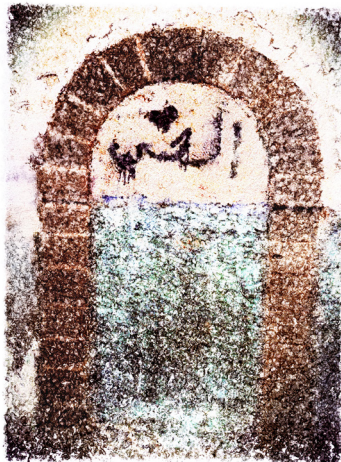
Amour interdit, Essaouira 2025, 100 x 70cm

Vernissage: Freitag, 28. November 2025, 17.00 Uhr